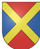
Comune di Gordola