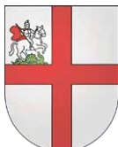
Comune di Brissago