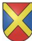
Comune di Gordola