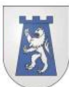
Comune di Losone